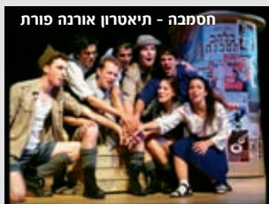
הסמכה - תיאטרון אורנה פורת